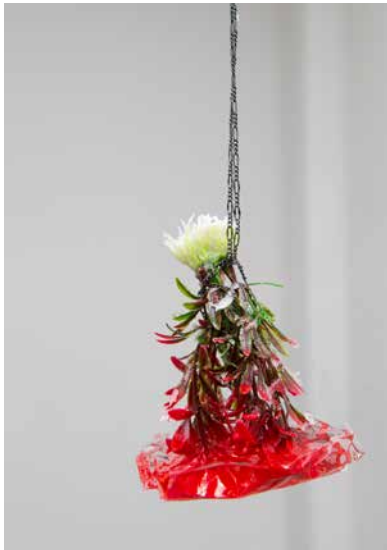
Plant 1 (red) , 2019. Silicona, plástico, vidrio, metal. 12 x 15 cm