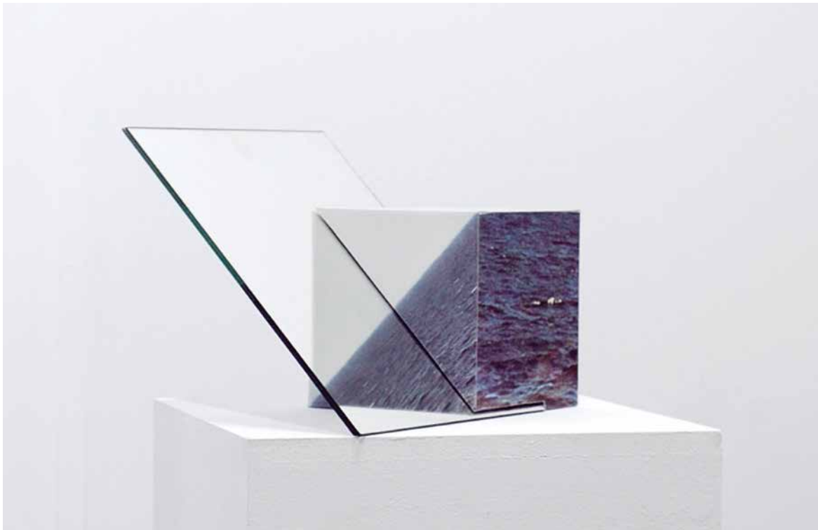
Donde existe un siempre , 2017. Cubo fotográfico y espejos. 40 x 15 x 45 cm