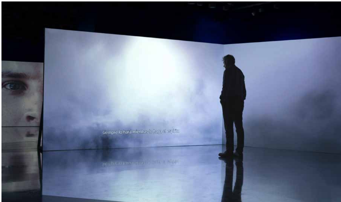
Introduction to time travel , 2016. Vídeo instalación, vídeo 4' (Loop) dos canales Full HD. Medidas variables.