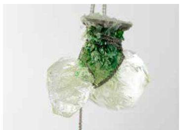
Liquid bondage , 2019. Silicona, poliuretano, metal. 16 x 26 cm Frost bondage , 2019. Silicona, plástico, vidrio, metal. 18 x 14 cm