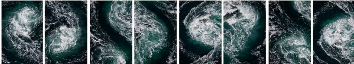
Maelstrom Module Variation II - TORUS , 2011 - 2013. Inyección de tinta pigmentada ultrachrome sobre papel de algodón. 55 x 77 cm c/u.