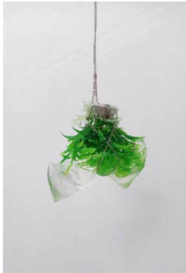
Plant 2 (green) , 2019. Silicona, plástico, vidrio, metal. 18 x 14 cm